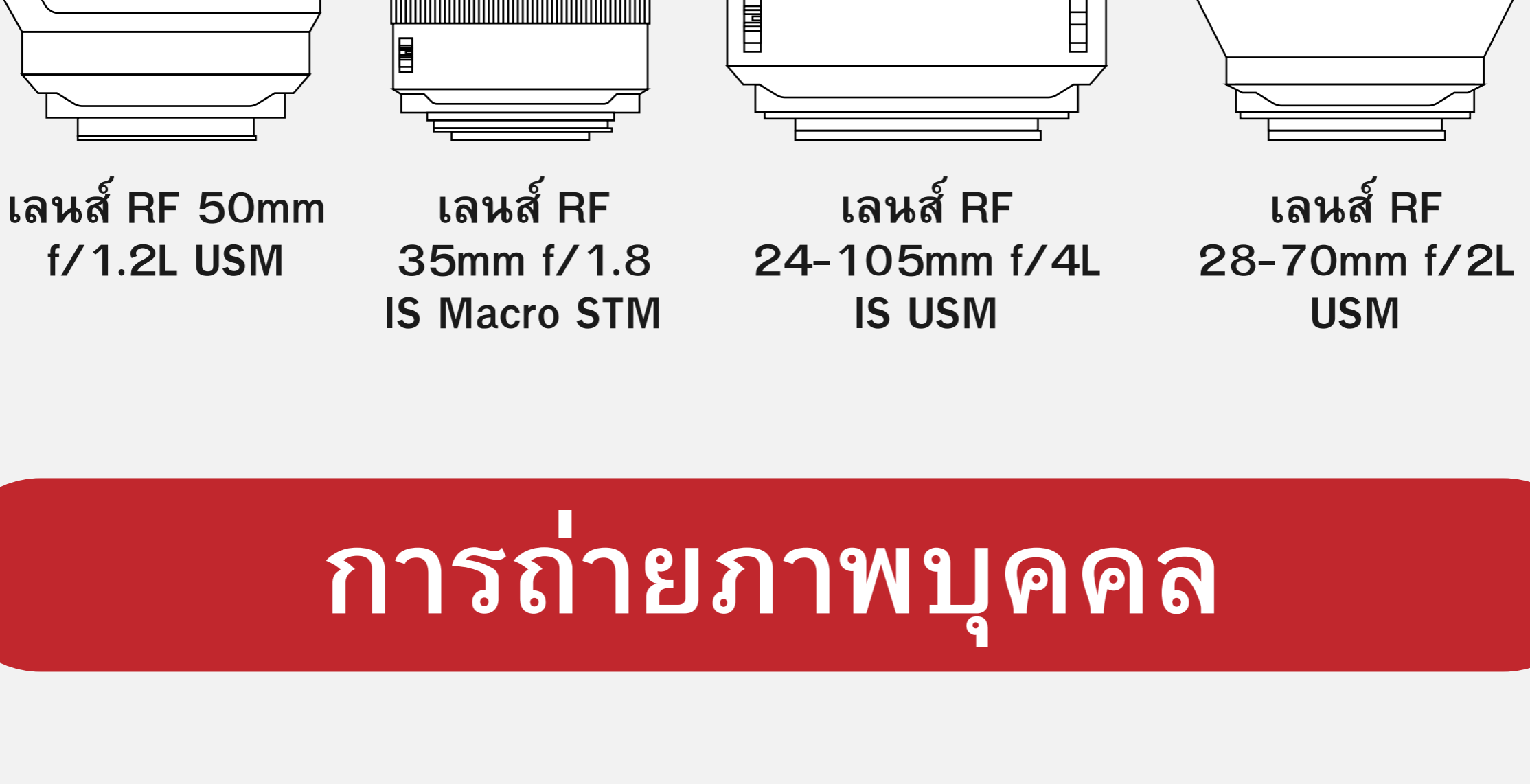
เลนส์ RF 50mm f/1.2L USM

ซีรีส์ RF เป็นเลนส์คุณภาพสูงที่มีหลากหลายรุ่นผลิตมาโดยเฉพาะสำหรับกล้องมิลเลอร์เลสฟูลเฟรม EOS R เรามาลองสำรวจความสนใจในการถ่ายภาพที่แตกต่างกันและค้นหาสิ่งที่ดีที่สุดสำหรับคุณ